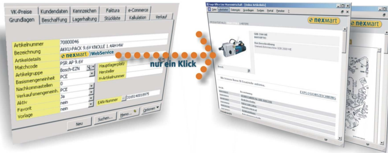
Beispiel für die Integration von Produktdetails

Sie haben nicht alle Produktdetails in Ihrem Warenwirtschaftssystem hinterlegt? Auch aktuelle Preise und Verfügbarkeiten sind Ihnen unbekannt? Was machen, wenn die angeforderten Stammdaten der Lieferanten nicht die für Sie wichtigen Informationen beinhalten? Abhilfe schaffen die nexMart webServices. Nutzen Sie die Daten aus dem nexMart Portal, ohne Ihr gewohntes eigenes System verlassen zu müssen.